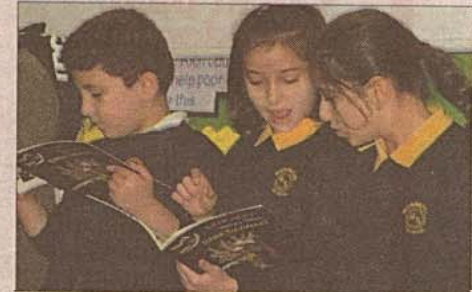
Çevre, dostluk ve çok kültürlülük gibi temaları