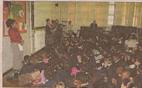
Dilek Ağacı isimli kitabın tanıtımı Hackney